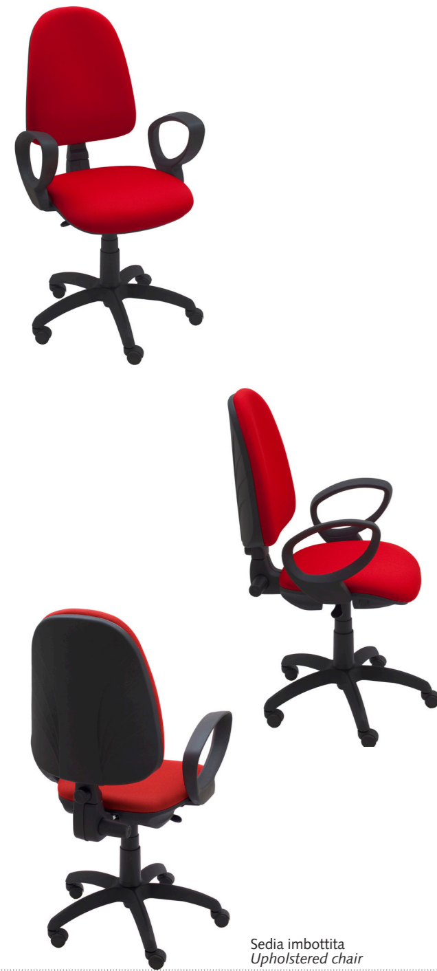
Sedia imbottita Upholstered chair