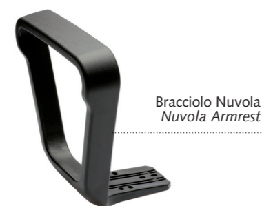
Bracciolo Nuvola Nuvola Armrest