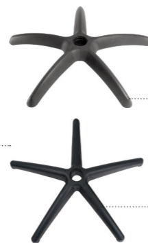
Base 630 630 base