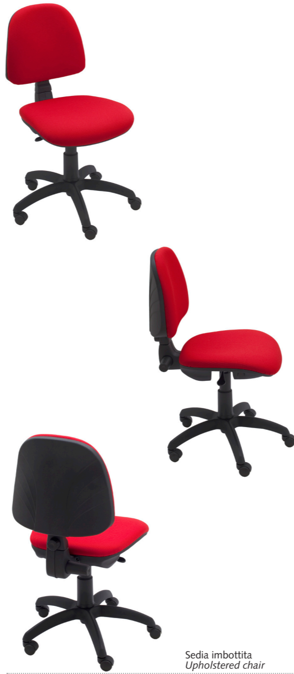
Sedia imbottita Upholstered chair