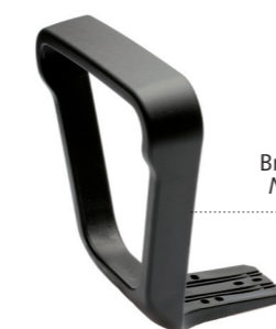
Bracciolo Nuvola Nuvola Armrest