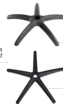
Base 630 630 base