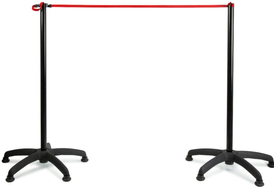
Kit 5 piedini per base 630 mm